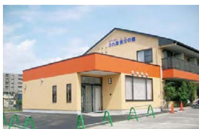
「ふれ愛」の施設の建物外観。すぐ横には広い駐車場も完備。どの支援サービスにも「足」は欠かせない。