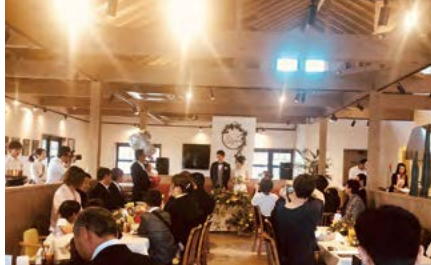
80名ほどを収容できる店内では、全店貸切でのレストランウェディングも可能。