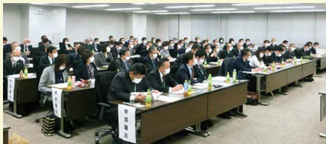
福祉事業団体幹部職員研修