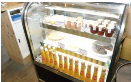
レジ横の保冷ケースでは地場産の原料から手作りされたドレッシングやイチゴバターなども販売。