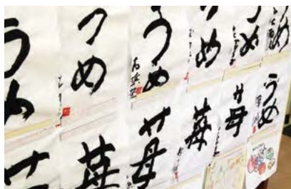
デイスサービスを利用されるお年寄りのみなさんの書道作品。どれも個性的でほほえましい。