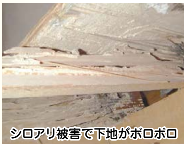
シロアリ被害で下地がボロボロ