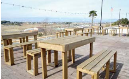
屋外のテラスと店内のテーブルは社員みんなのDIY。この夕陽の綺麗な丘の上の席からは伊勢湾が見渡せる。