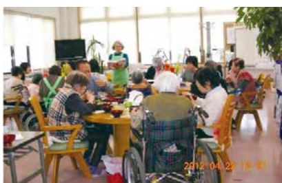
グループホームをご利用の方のご家族との家族会。ご本人とご家族とみなさんが集まっての交流を図ります。

現場の実態に即して、「高齢・障害者」というハイブリッドなカテゴリーができていくのかもしれない。