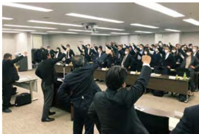
2020春季生活闘争総決起集会

これからヤマ場を迎える2020春季生活闘争において、要求実現と機運の盛り上げをはかるために行われたこの集会は、例年通り屋外での大規模集会を予定していましたが、新型コロナウイルス感染症の国内発生を踏まえた対応として、急遽ワークライフプラザれあるにおいて、連合愛知三役・執行委員・構成組織・地協の参加のもと開催しました。