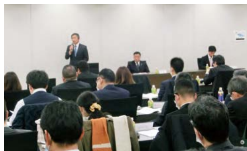
助け合い運動支援金合同寄託式