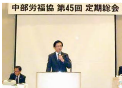
中部労福協第45回定期総会