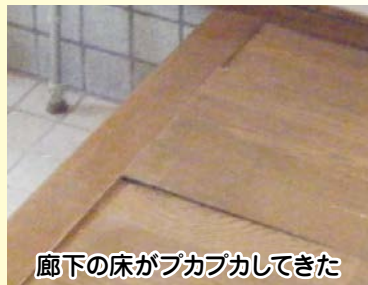
廊下の床がブカブカしてきた