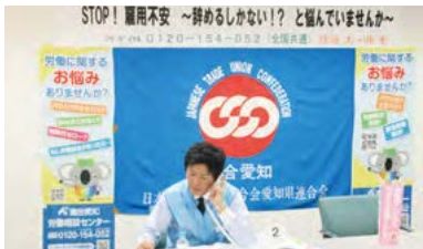
全国一斉集中労働相談ホットライン

今回は『「STOP!雇用不安」～辞めるしかない!?と悩んでいませんか～』をテーマとして実施し、2日間で53件の相談が寄せられ、連合愛知ならびに11地協役員が相談役として、アドバイスや労働契約法の説明など真摯に相談を受けました。潜在的なニーズに対応するため、今回試験的に相談時間を2時間延長した結果、19時