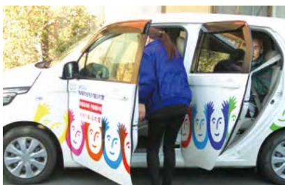
「毎日のデイスサービスでの送迎。パンのほうがり降りしやういが、小型車の方が細い道では小回りが効く。