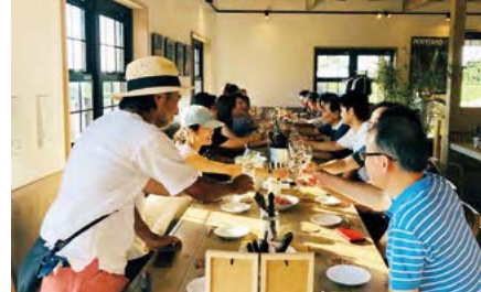
地ワインを囲んでのワイナリーツアーのパーティー。この地でこそ味わえるワインに恵まれるしあわせ！