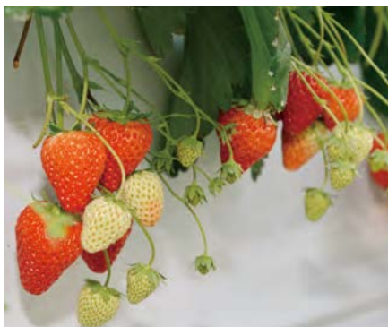
イチゴは、酸味が少なく糖度の高い「章姫(あきひめ)」など。果皮が薄いので、そのままパクついた時の食感がいい。