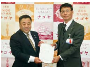
▲名古屋市 要請書提出