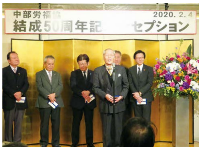
結成50周年記念レセプション

また、今回は中部労福協結成50周年にあたることから、「結成50周年記念レセプション」も併せて開催され、歴代の役員の皆さまを交えた和やかなひと時となりました。