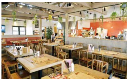
ここは世界的なレストランガイドGault & Millau(ゴ・エ・ミヨ)でも紹介。奥には地ビールのサーバーも。