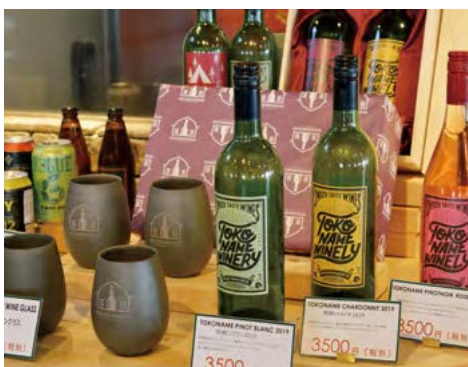
レストラン内にあるショップコーナーに並ぶ「地ワイン」と常滑焼で作られたオリジナルデザインの重厚なゴブレット。