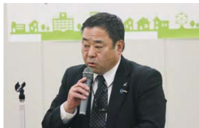
畑副会長による集会アピール

続いて、畑副会長が「集会アピール」を読み上げ参加者全体の総意で採択し、木戸副会長によるガンパロー三唱で春闘勝利への意思固めを行いました。