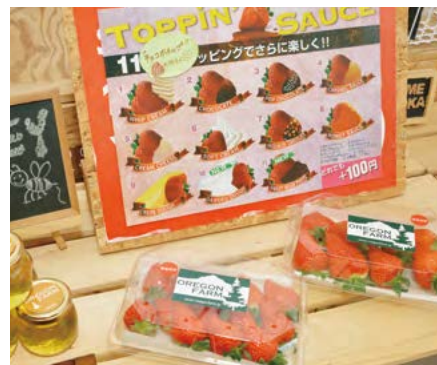
オレゴンファームならではのユニークなサービス。11種のトッピングでもぎたてイチゴにもうひと味プラス。