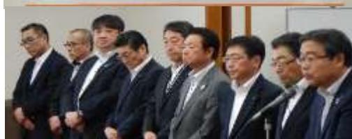
新役員を代表して挨拶する黒崎会長