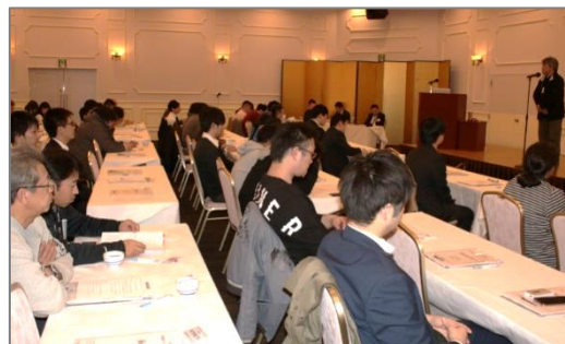
北鹿新聞社提供(2月14日掲載より)

アンケートでは、このセミナーを聞いて自分の将来に不安を感じた人が半数以上にものぼり「早めに検討すべきことがわかった」「将来に向けて貯蓄を見直したい」などのコメントが寄せられた。