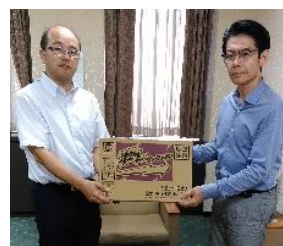
全水道労組川辺委員長(左)より定額給付金を活用してカップ麺とミネラルウォーター寄贈