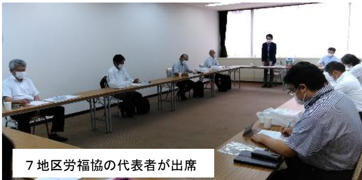
7地区労福協の代表者が出席

8月31日(月)フォーラムアキタにおいて開催した。年間活動計画に伴う県労福協から各地区労福協活動への協力要請などを行い、県労福協と地区労福協が相互に連携しながら活動を展開していくことを確認した。