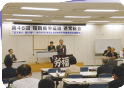
北九州市産業経済局川原課長