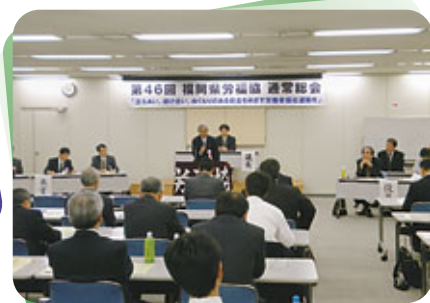
福岡県退職者団体連合橋口会長