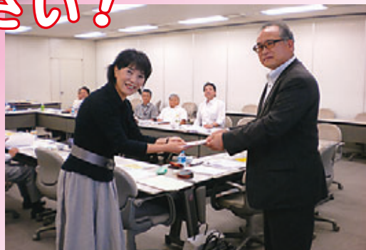
高島県労福協会長(写真右)より行岡グリーンコープ生活再生相談室長(写真左)へ福祉募金カンパ贈呈

2009年7月1日第1回県労福協理事会にて、緊急な生活貸付のためのかさじぞうカンパとして、県労福協福祉募金より、10万のカンパ金拠出を満場一致確認を致しました。