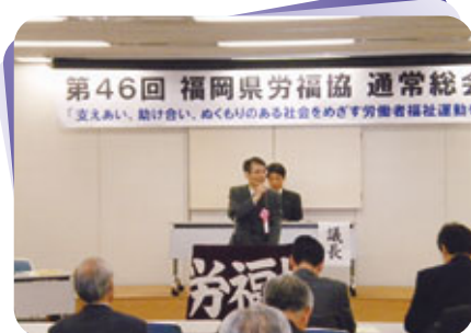
福岡県福祉労働部松永局長