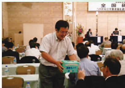
全国研究集会会場でのカンパ183,858円