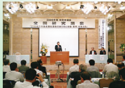
笹森中央労福協会長挨拶