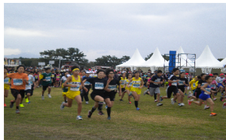
2 km 小学6年生のスタート

特に、福岡県労協会員である各地域労協、連合福岡、九州労働金庫福岡県本部、全労済福岡県本部、福岡県生協連の皆さまには、ボランティアスタッフの派遣並びに大会協賛に多大なご支援を頂きましたこと厚く感謝申し上げます。