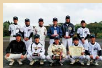
優 勝 HOTクラブチーム