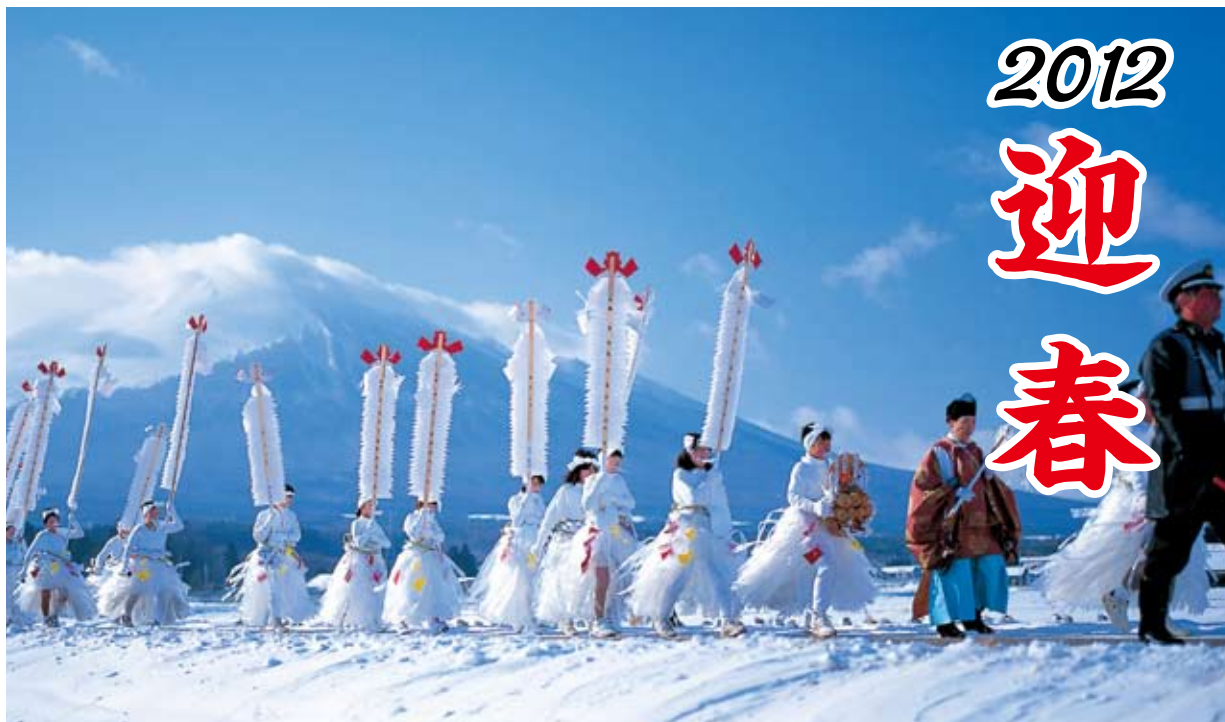
(八幡平市 平笠の女裸参り)