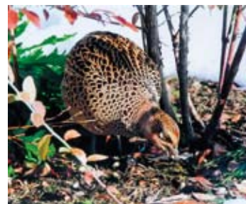
写真 知事賞受賞作品