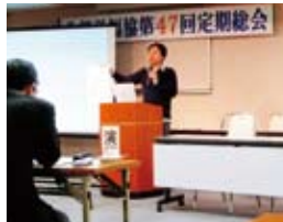
小山福島大学准教授による講演会