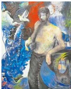
絵画 知事賞受賞作品

絵画 及川 久 示現会会員、岩手芸術祭美術展洋画部門常任理事 写真 小川文男 岩手県写真連盟会長 書道 吉田晨風 岩手書道協会副会長