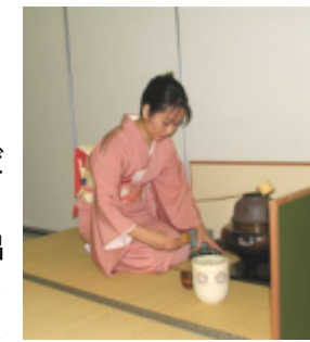
肥後古流のお点前