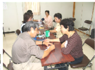
血圧、血糖値測定、健康相談