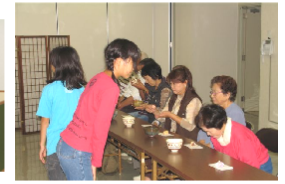
「緊張シター！」 「おばちゃんもタイ！」