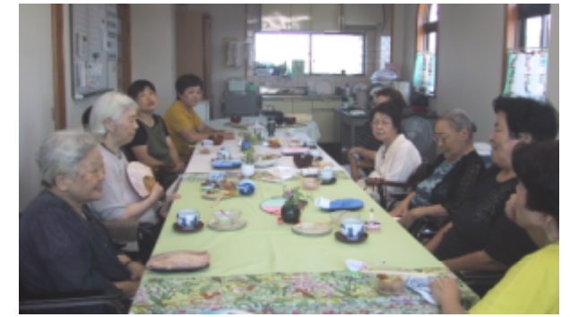
ふれあい昼食会の参加者 8月(6名)9月(6名) 10月(8名)