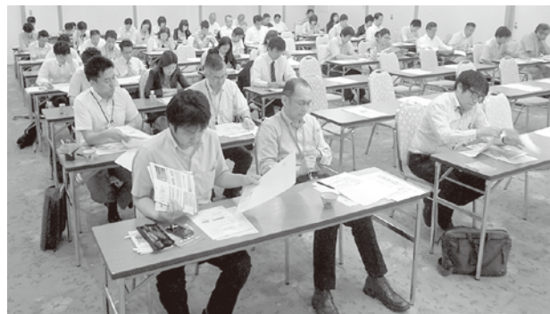
▲熱心に聞き入る参加者