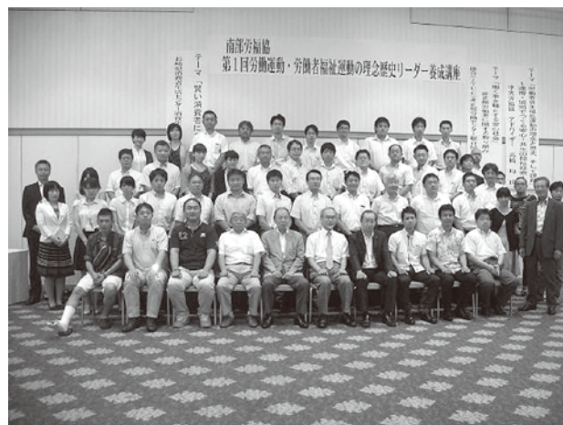
▲参加者全員の集合写真

▲研修内容を次回に活かすためアンケートを実施したところ、非常に高い評価となった。全体的に「良かった・ほぼ良かった」が91%を占め、時間を延長してでももっと講義を聞きたかった、などの希望が多かった。また、労働運動、福祉運動の歴史とろうきん・全労済運動に対する理解が得られた回答が多く、事務局としては嬉しい限りである。講師に感謝したい。