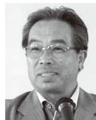
日ごろの御礼を述べる原田本部長

冒頭、原田本部長（全労済長崎県本部）より、「日ごろからの全労済の活動に感謝申し上げます。本日は長崎県下から全労済担当者の皆さまに参加いただき非常に嬉しく思います。研修会を通して意見交換をおこない、是非交流を深めてください」と挨拶がされました。