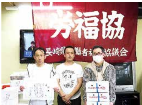
優勝チーム(J P 労組諫早)