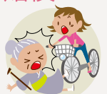
自転車でごり押しでけがをさせた