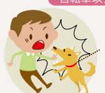
飼っている犬が他人にけがをさせた