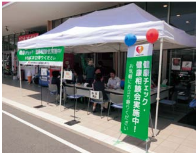
コープ春日店前の健康チェック・健康相談会場

九州沖縄、中国四国両ブロックの医療生協が職員を派遣し、4月末から毎週金曜日の開催を続けていて、当生協からも5月13日に2名が参加しました。健康チェックでは血圧や骨密度、血管年齢などを測定し、その後医師や看護師による健康相談もできます。こどもを連れたお母さんや年配のご夫婦など幅広い年代の方々が利用されていました。「夜眠れないのが一番つらい」、「食生活が乱れている」などの相談もあり、余震を警戒しながらの生活で、健康に不安を持つ方が多いことがうかがえました。「来週もやってくれるの?」という声も聞かれ、こうした取り組みが、少しでも被災地の皆さんの健康回復につながればと感じました。