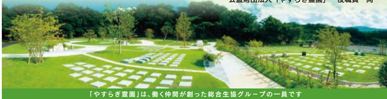
「やすらぎ霊園」は、働く仲間が創った総合生協グループの一員です