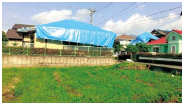
瓦の崩落などの被害でブルーシートをかけた屋根が並ぶ 熊本市内の様子