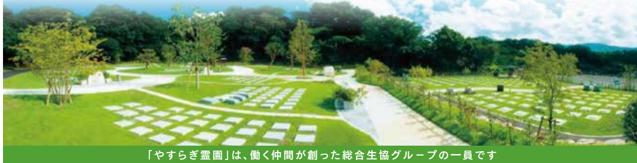
「やすらぎ霊園」は、働く仲間が創った総合生協グループの一員です