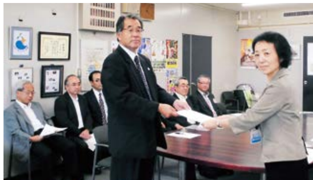
出席者 大分県生活環境部