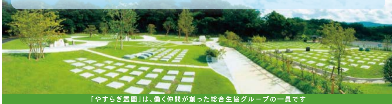
「やすらぎ霊園」は、働く仲間が創った総合生協グループの一員です

有期限墓地 10~30年間の有期限契約で草花がお墓を包む新しい形のお墓です。撤去費を含みます。