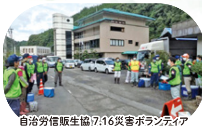
自治労信販生協7.16災害ボランティア

今年は、1月に中国で発生した新型コロナウイルスが瞬く間に全世界に感染拡大し、健康面だけでなく、世界経済が大打撃を受け、収束が見えない状況が続いています。また、感染対策に伴う活動の自粛は生協にも大きな影響を与えており、毎年継続してきた平和行動（親子で考える県内戦跡巡りやナガサキ行動）は中止となりました。