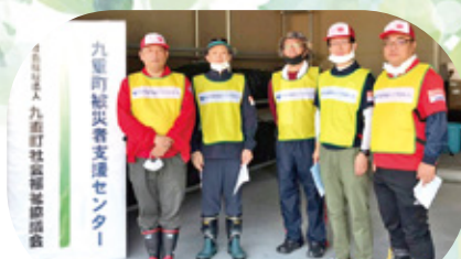
コープおおいた 災害支援チーム(10日間50名)