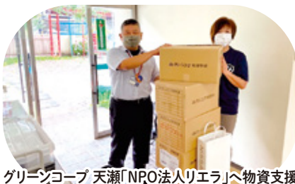
グリーンコープ 天瀬「NPO法人リエラ」へ物資支援