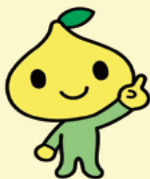
公式キャラクタービットくん