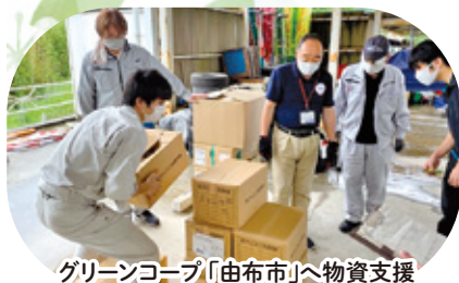
グリーンコープ「由布市」へ物資支援