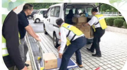
コープおおいた 天瀬地区へ物資支援