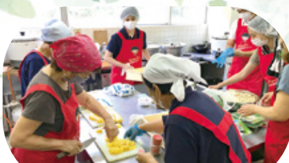
コープおおいた 天瀬地区炊き出し支援