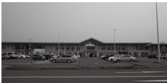
道の駅 思川 全景

また、1600(慶長五年)の関ヶ原合戦の直前、7月24日に下野国小山(現在の栃木県小山市)で開かれた歴史的会議である「小山評定」にちなんだ地酒なども発売されています。小山駅からは毎日バスも運行していますので、ぜひお立ち寄りください。