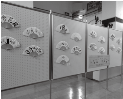
書道受講者作品展

日頃の成果を作品として制作したものです。自分でしたための書を扇子という形で表しました。