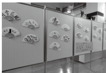
8/19～23 書道教室 第3回作品展(扇子)