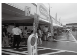
越戸店でのイベントに 合わせて取り組まれた フードドライブ

9月8日(日)、コープ越戸店(宇都宮市)において、フードドライブ(※1)に取り組みました。この活動は賞味期限内でまだ安全に食べられ、家庭で眠っている食品を寄贈していただき、必要としている福祉施設や団体などに無償で提供し、活用してもらうものです。