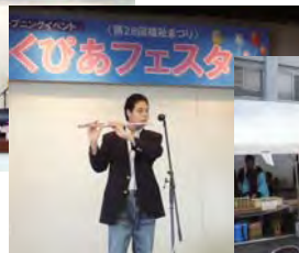
2009.11.7 第 2 回 わーくびあフェスタ