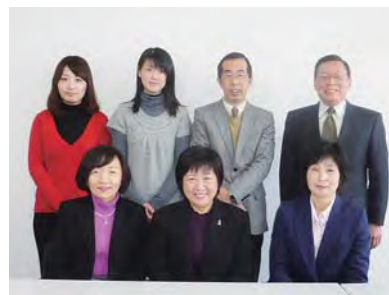
ライフサポート事業部スタッフ

受講生は全員が女性で、ほとんどが日本人配偶者です。期間中、「講座に出会えたことで目標が持てるようになった、前向きに物事が考えられるようになった」という声が多く受講生から寄せられました。今後も「日本で子育てや仕事をして家族や社会のために役に立ちたい」と願う外国の人たちの思いに応えていく立場と責任を貫き、だれもが社会とのつながりを感じられるようなチャレンジができる地域づくりへとつなげていきたいと思っています。