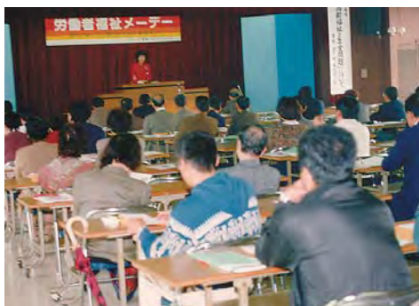
第 1 回労働者福祉メーデー 1993.11.11

すべての国民が生活にゆとりを持ち、充実した自由な時間とうるおいのある生活を送ることができる人間性豊かな福祉社会の実現をめざし毎年 11 月 11 日に開催しています。