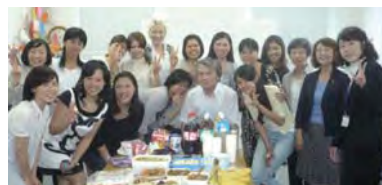
2010.7.9 就職のための日本語講座修了式

職場で通用する日本語やビジネスマナーの習得を目的とした「就職のための日本語講座」と、介護資格取得につなげるための「介護の日本語講座」の2講座を日本語支援団体「J T M とくしま日本語ネットワーク」との連携により2009年度に開設し、2年間で8カ国29名が受講しました。うち5名がホームヘルパー2級の資格を取得し、3名が介護施設に就職しました。他の受講生も小売業やサービス業、教育支援業等に就職を果たしました。また、理容師になるために専門学校受験を目指して勉強中の人、看護師になるため大学受験を目指している人等、それぞれの目標に向かって挑戦を続けています。