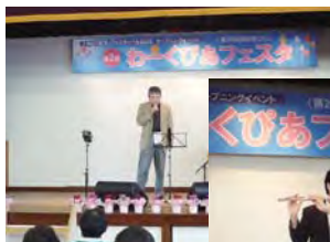
2008.11.8 第 1 回 わーくびあフェスタ