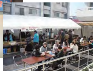
2010.11.6 第 3 回わーくびあフェスタ