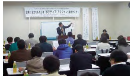
2010.3.2 ポジティブ・アクション実践セミナー

当センターでは徳島県より委託を受け、2005年度より次世代育成支援のための職場環境整備事業を行っています。事業所訪問やセミナーをとおして、育児休業や短時間勤務、看護休暇などの両立支援制度の導入と、制度を利用しやすい職場風土を一体的に推進することを提案しています。これまでに訪問した事業所はのべ1,500件にのぼっています。