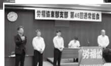
磯見新支部長(右端)