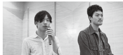
抱負を語る2名の研修医