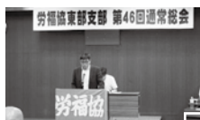
大竹支部長 あいさつ