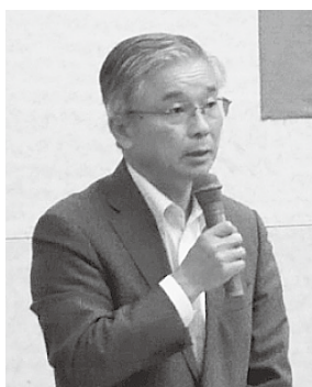
【代表挨拶 大泉理事長】

トの準備をしていきたい。山形でも地域におけるサポート体制を更に強化していただきたい」との挨拶をいただきました。