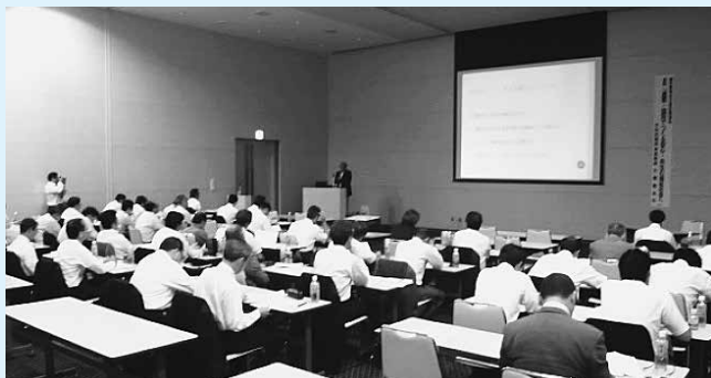
【講演会会場の様子】

また、講演の最後に2015年度の重点活動として「奨学金問題」を挙げ、これは単に奨学金の問題だけではなく、「返したくて返せない」というのは非正規雇用などの不安定雇用や低賃金労働者の増大といった「雇用問題」に関わる問題であるし、「子どもの貧困対策」「貧困の連鎖解消」という視点からも一体的に取り組む必要があると指摘。今後中央段階で対策チームを立上げ、政策課題の整理や労働者自主福祉活動として出来ることの検討などを行っていく予定です。