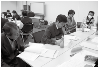
幹事会・専門局の活動の様子

開催し、生活者、働く者の立場を代表して日々希望と安心社会を築くよう、労働運動の社会的役割を果たすべく奮闘していきます。