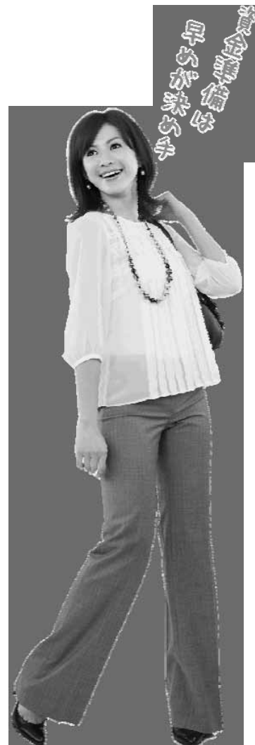
ろうきんイメージモデル 高垣麗子