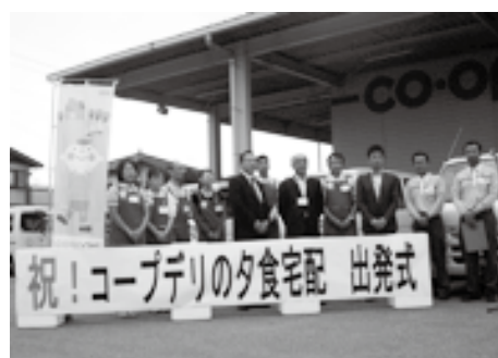
10月22日出発式の様子

たが（関西生まれです）おいしくいただきました。今後ともよろしくお願いします」「今秋はじめてのサンマをいただきました。大根おろしが付いていたので助かりました。ご馳走様でした」など、歓迎の声が寄せられました。 来年4月をめどに宇都宮地域でも実施し、今後3年間で県内全7事業所に拡大していく予定です。