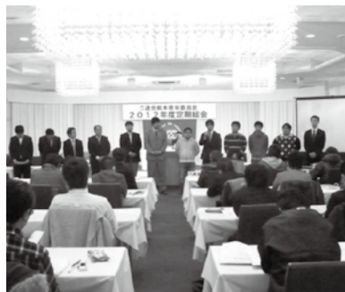
2012年度青年委員会定期総会(新役員)

今年の一月二一日に開催された「連合栃木青年委員会定期総会」において、青木会長は、「若い世代の皆さんの出会いの場が少ないと言われている。ぜひ、婚活なども含めて組合員が元気になるような企画をお願いしたい。既存の概念に固執せずに、若い感覚で必要な運動は進めてほしい。これからの連合栃木の運動だけでなく、企業や職場や社会自体も、皆さんの両肩にかかっていることを忘れないでほしい。」と、期待を込めて挨拶されました。