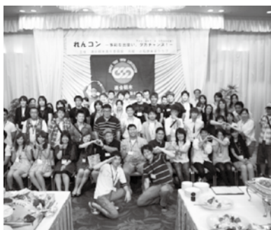
(連合栃木 森下) れんコン。多彩な出会い!夕方チャンス!

未来のまちを担う子どもたちを育て、現在のまちを創ってくれたお年寄りを支えてくれるのも、今の青年層です。彼らの声や思いが労働者福祉運動や社会運動にも届くよう、青年委員会の強化に取り組んでいきたいと思っています。