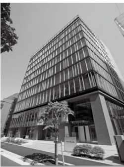
【中央ろうきん本店ビル】

一部のみの入金もできる。また、ATMで振込を行なう場合、振込の予約が可能になる。登録済みの振込先内容（10件を表示）から振込先を選択できる。「手数料込み」の振込も行なえるようになる。など一段と便利になる。